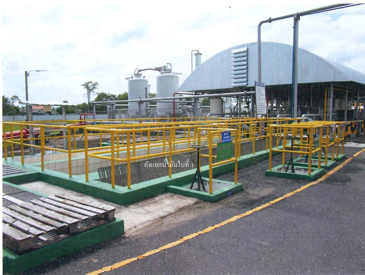
รูปถ่ายที่ 1 ถังแยกน้ำมันใบที่ 1 แบบ CPI ที่อยู่ภายในคั่งน้ำมันเซลล์บ้านดอน สุราษฎร์ธานี